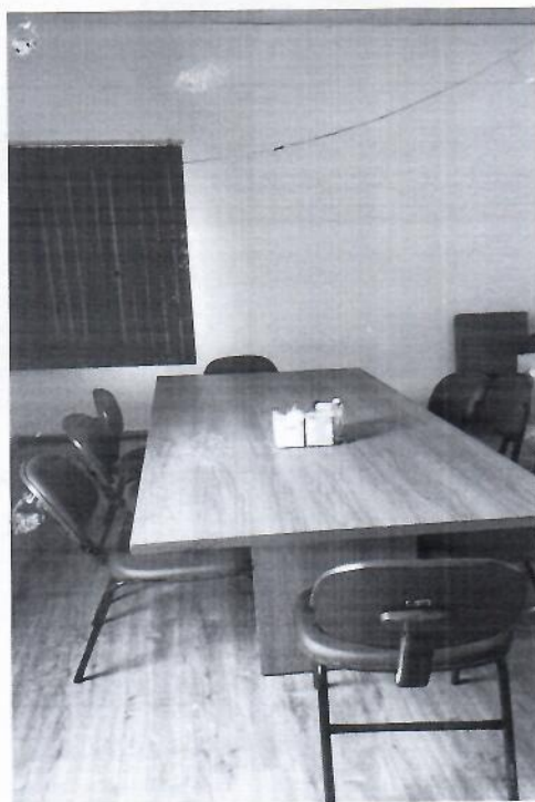
Estrutura física adequada para as reuniões dos conselhos municipais