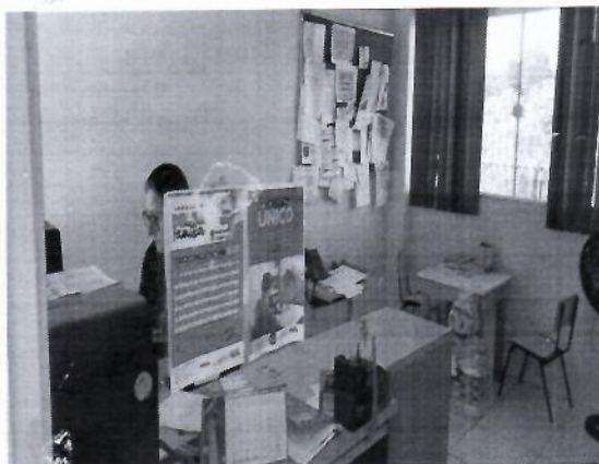
Gestão e operacionalização do Cadastro Único