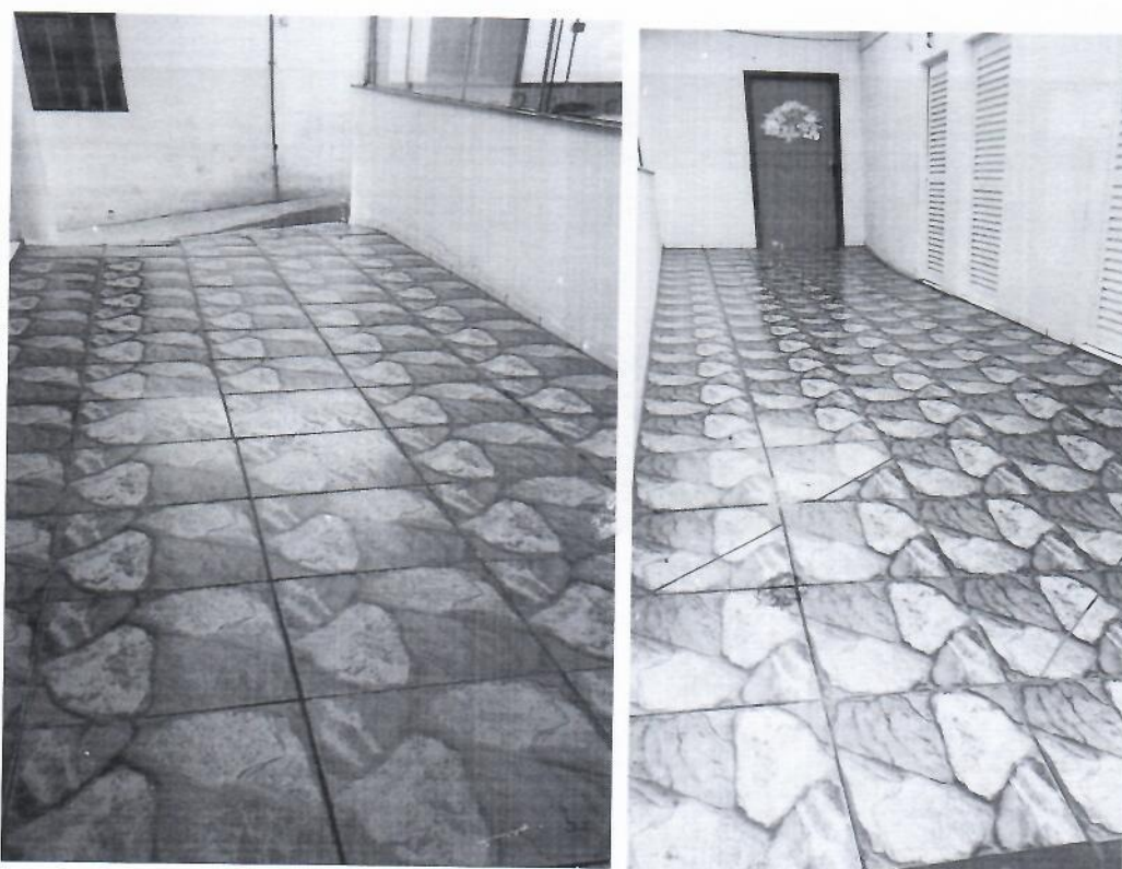
Melhorias e reformas realizadas no Cras conforme a necessidade. Nesta foto adequação do piso que dá acesso aos sanitários de uso das crianças do SCFV.