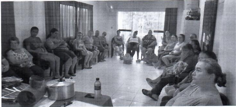
Oficina com as famílias que participam do PAIF